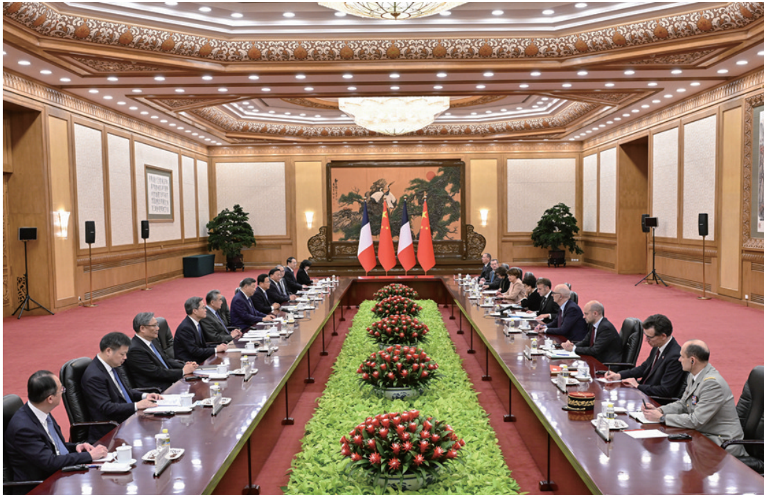
□12月4日上午，国家主席习近平在北京人民大会堂同来华进行国事访问的法国总统马克龙举行会谈。

马克龙表示，法中保持密切高层交往，始终相互信任、相互尊重。法方重视对华关系，坚定奉行一个中国政策，愿持续深化法中全面战略伙伴关系。法方乐见中国经济蓬勃发展，坚持开放合作，为世界带来更多机遇，愿同中方促进相互投资，加强经贸、可再生能源等领域合作，促进友好文化交流。法方欢迎中国企业更多赴法投资，愿提供公平、非歧视营商环境。法方致力于推动欧中关系健康稳定发展，认为欧中应坚持对话合作，欧中应实现战略自主。面对世界地缘形势不稳、多边秩序受到冲击，法中合作更