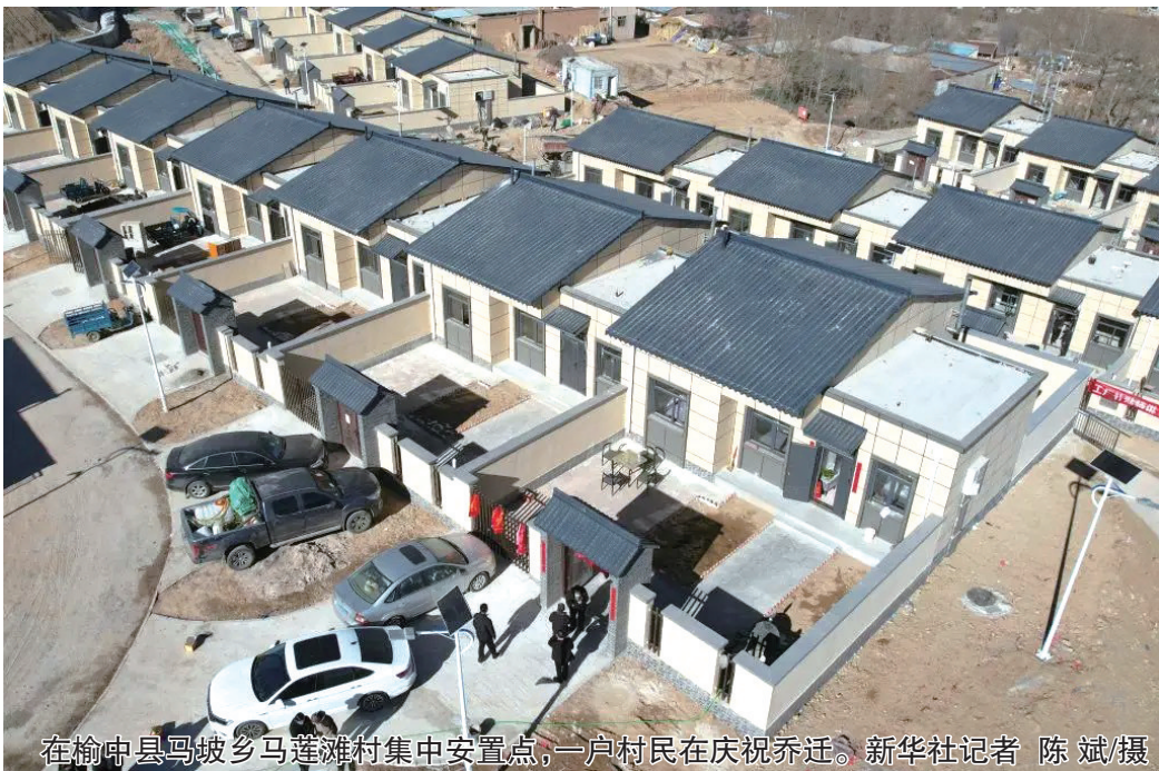
在榆中县马坡乡马莲滩村集中安置点，一户村民在庆祝乔迁。